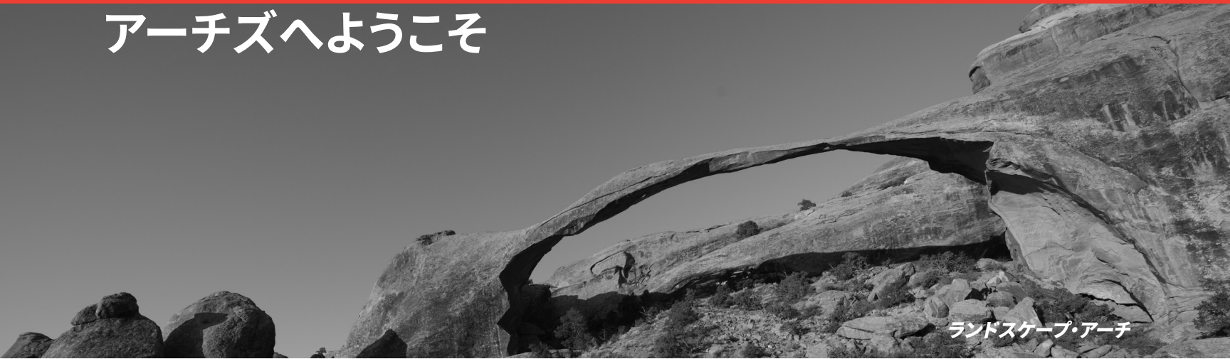
ランドスケープ・アーチ

水と氷、極端な温度と地下の塩の移動により、アーチズ国立公園の岩の景色が形作られています。晴れ渡った青空の日に、1億年も浸食という激しい力により、この土地が世界で最も高密度の自然のアーチを形成したことを想像するのは難しいでしょう。2,000以上のアーチには、小さいもので0.9メートルの開口から、長いもので端から端まで約91メートルもあるランドスケープ・アーチと呼ばれるものまであります。