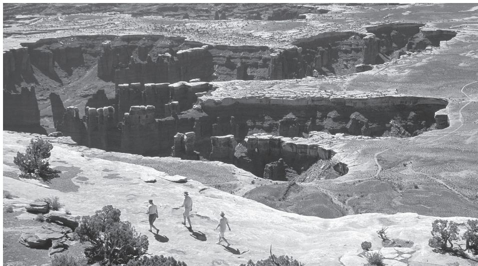
Grand View Point, Island in the Sky

En gran medida, Canyonlands continúan siendo salvajes hoy en día. Sus rutas no están pavimentadas en su mayoría, los senderos son primitivos, los ríos fluidos. Borregos, coyotes, y otros animales nativos se encuentran merodeando sus 527 metros cuadrados. Canyonlands es América salvaje.