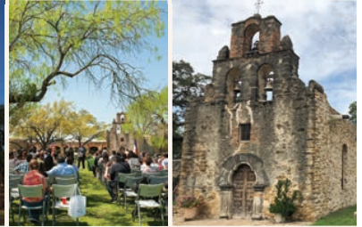
Naturalization ceremony, church. Ceremonia de naturalización, iglesia.