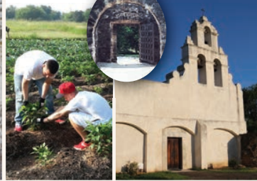
San Antonio Food Bank volunteers planting, mission entrance gate, church. Voluntarios del Banco de Alimentos de San Antonio plantando, puerta de entrada a la misión, iglesia.