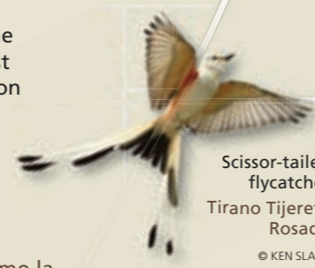
Scissor-tailed flycatcher Tirano Tijereta Rosado

La agricultura de las misiones se basaba en sistemas de acequia impulsados por la gravedad. Estos sistemas de riego utilizaban presas, acueductos y zanjas para desviar el agua del río San Antonio a los campos de cultivo. En la foto de arriba izquierdo, un guardaparques está levantando una compuerta en la misión San Juan. El acueducto Espada (arriba), al oeste de la misión San Juan, es el único acueducto español que queda en los Estados Unidos.