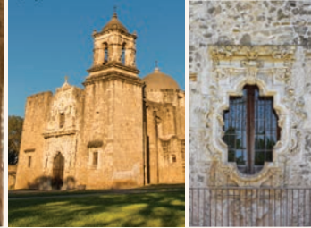
Restored church, Rose Window. Iglesia restaurada, la Ventana de Rosa.