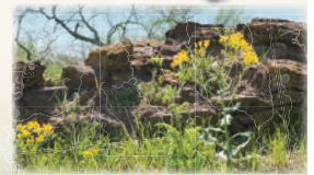
Ruins at Rancho de las Cabras, the ranch brand. Ruinas en Rancho de las Cabras, la marca de chisero

Las ruinas y praderas nativas en Rancho de las Cabras son todo lo que queda de los ranchos de las misiones (foto abajo). Los hombres jóvenes de la misión Espada cuidaban cabras, caballos, ovejas y vacas en sus 4,000 acres. En el pasado, el rancho tenía una capilla y altos muros para su protección.